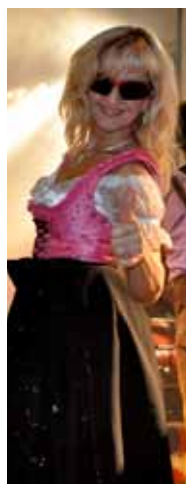
The Show must go on