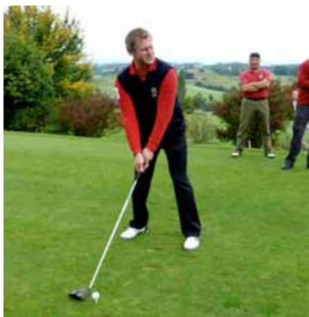
Geniales Ansprechen des Balles, bereits mit Unterdruck;

* PGA = Private Grandiose Abschlagsvereinigung