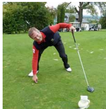
Geschafft: der stolze Rekordhalter sichert sich seine „Prügelkugel“!