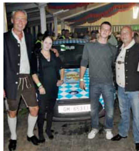
Glücklicher Kirchhamer Autogewinner mit Wirt (re.)

Keine Kosten und Mühen gescheut hat das Team der Familie Stoiber, um neben einem tollen Golfturnier von 17. bis 19. September am Kampesberg eine Großveranstaltung mit eigenem Festzelt und tollem Musikprogramm auf die Füße zu stellen.