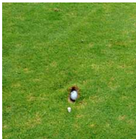
Beweisbild für das Buch der Rekorde: geniales „Spiegelei“!!;